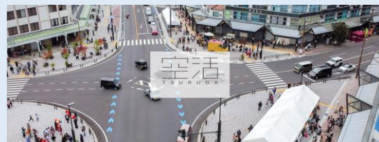
空活ホームページトップ

事業参画にご興味のある方や事業の概要について知りたい方は、ぜひご視聴ください。また、お申込みいただいた方にはアンケートを送付させていただきますので、ご協力をお願いいたします。