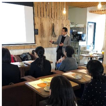
正しいランドセルの選び方セミナー