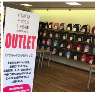
アウトレットランドセルフロア