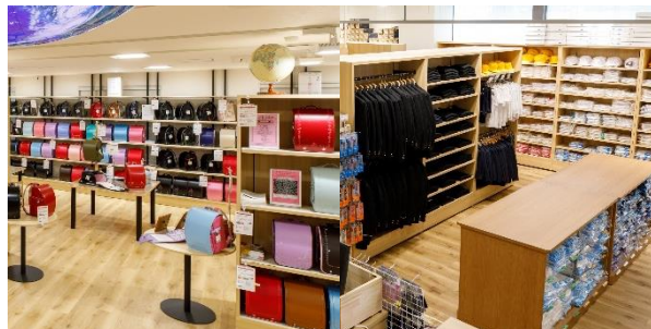
ふくふくらんど／ランドセルとスクールウェア専門店