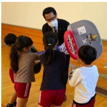
保育園等へのスポーツ普及活動