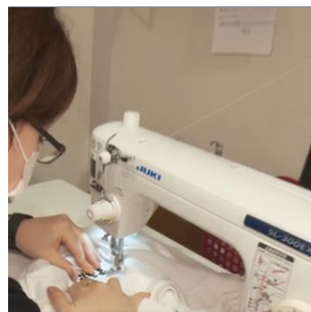
お直しやお名前入れなどお仕事で忙しい子育て家族をサポート