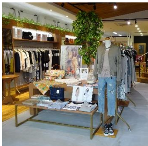
RaChic／レディスファッション