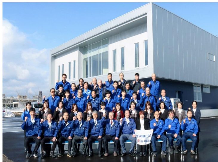
カネタ株式会社 令和4年1月5日