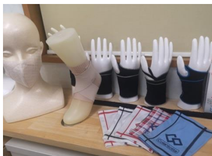
《医療器具製造への取組み》