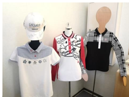
《当社製造のゴルフウェア》