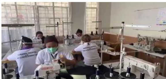
《フィリピン縫製技術訓練センターの様子》