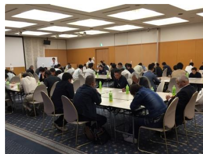
[関係企業との勉強会・セミナーの開催の様子]

また、定期的に「安全大会」を開催し家づくりに関わる安全と意識も高めています。(写真はその様子)