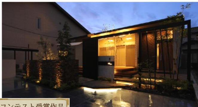
コンテスト受賞作品

住む人や訪れる人を心地よく迎えるお庭とエクステリア。 お家の顔とも言える外まわりは、住む人の個性やおもてなしの心を表現するとともに、街並みの景観を印象付けるものでもあります。 お客さまのご要望をしっかりと反映することはもちろん、ご家族のライフスタイルや10年後の住まい方も見据えたうえで本当に必要なあり方をイメージし、付加価値のあるエクステリアをご提案します。