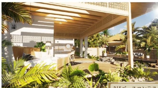
RIKパースコンテスト 受賞作品