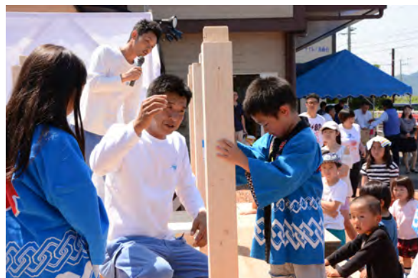
地域に密着したイベントの様子