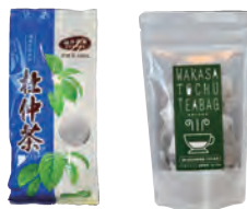
自社農園で栽培した杜仲茶の製造・販売