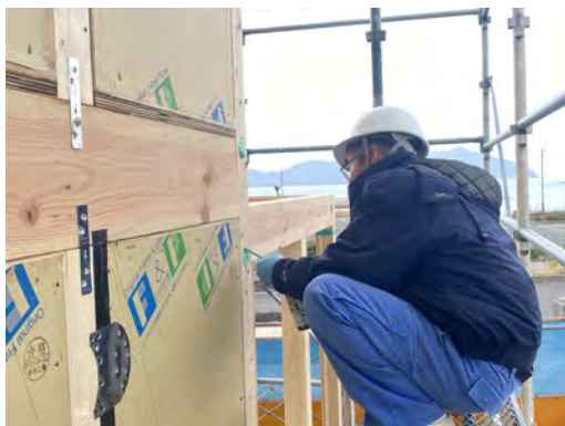
高気密高断熱「FP住宅」