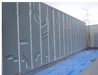
シーリング工事实施