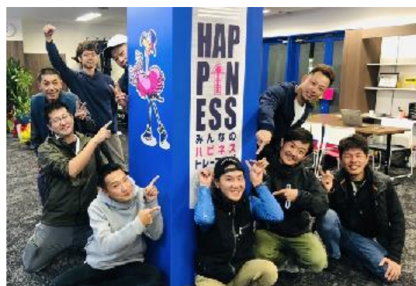
株式会社K's-interior 社員一同

活気があり明るいまちを未来へつなぐために、持続可能な社会の実現に貢献してまいります。