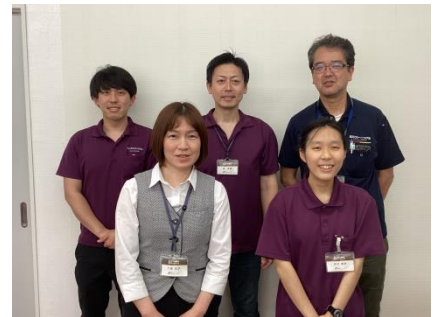
SDGsプロジェクトチーム

私たちはSDGsの取り組みを始めたばかりですが、全社員で協力し、掲げたSDGs宣言のゴールに向けて活動していきます。その中でもまずは、プラスチックハンガーの3Rをこれまで以上に強化していきたいと考えています。