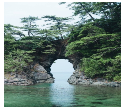
■ 浜茶屋しろやまから望む名称「明鏡洞」