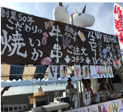
■ 浜茶屋「しろやま」は毎年賑いを見せており、町内のイベント等にも積極的に出店しています。