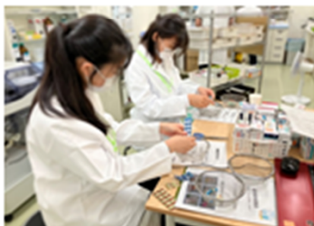
高校生の薬剤師体験