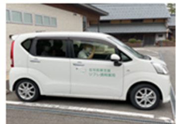
在宅訪問用専用車両