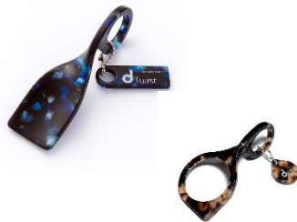
d-twist , d-drop loupe