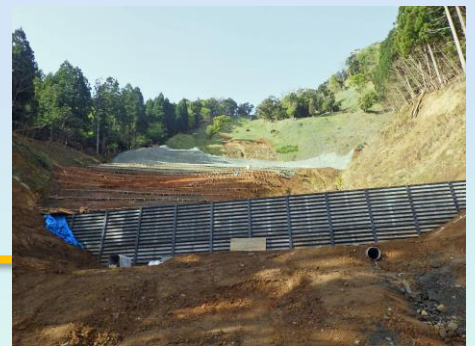
令和4年度 復旧治山工事 (若狭町 海山地区)