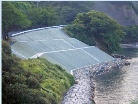
令和5年 道路防災対策工事 (若狭町 常神地区)