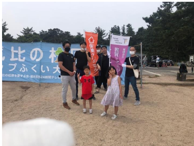
気比の松原清掃活動