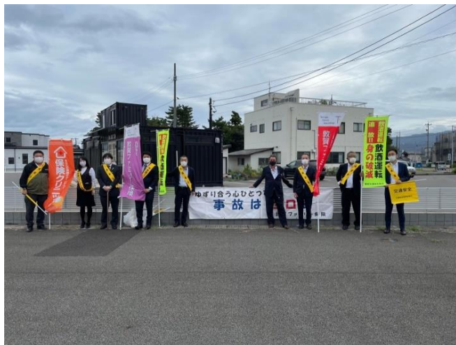
交通安全啓蒙活動