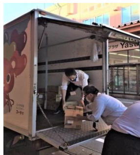
フードバンク活動 (食品ロス削減)