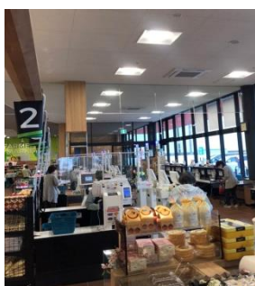
照度による自動調光 時間帯消灯システム導入