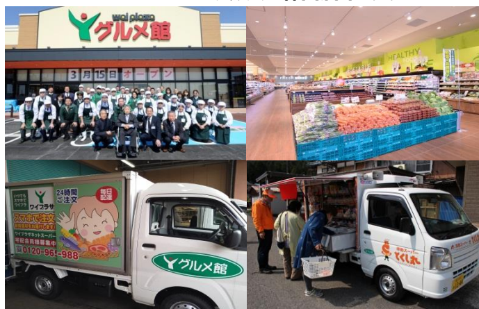
ネットスーパー 宅配