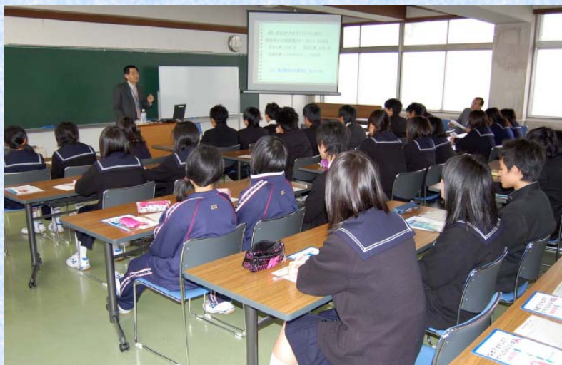
平成19年12月14日 高志高等学校