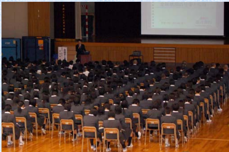
平成19年11月14日 福井商業高等学校