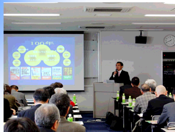
平成19年12月6日 事業承継セミナー