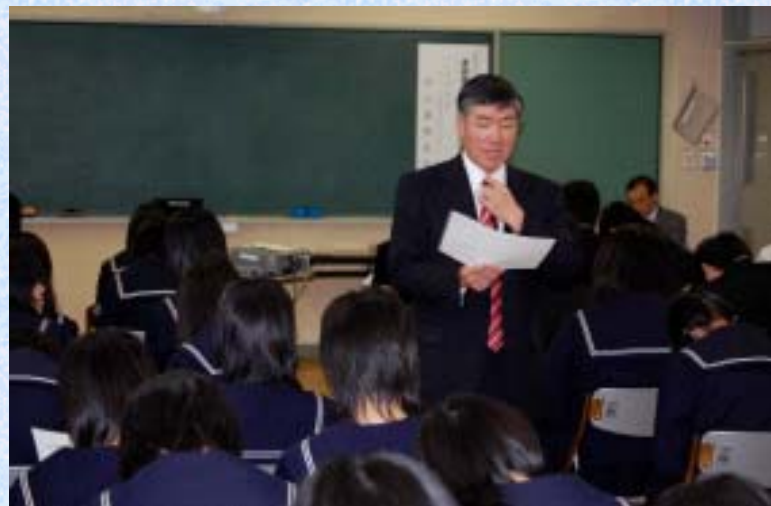
平成19年12月13日 金津高等学校