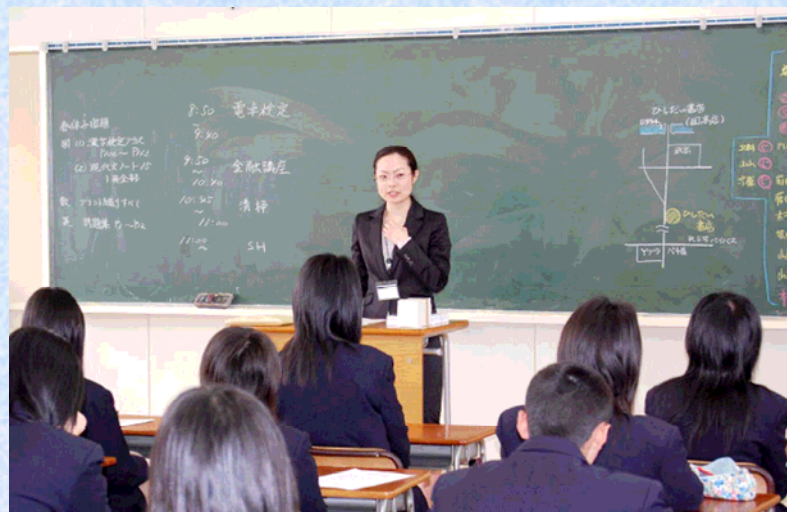
平成20年3月19日 武生商業高等学校