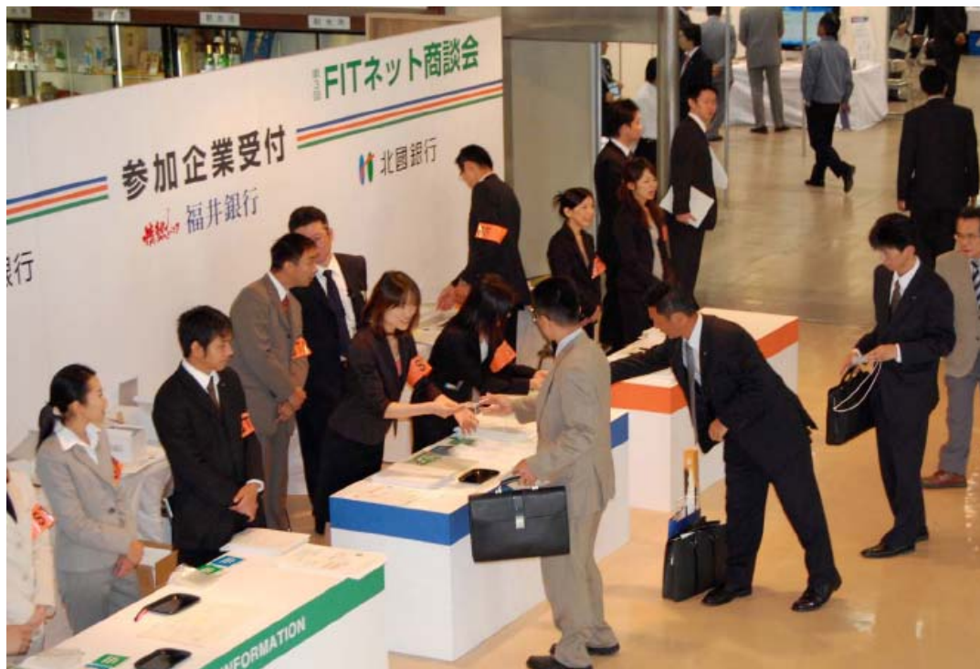
平成19年10月11日 第3回FITネットビジネス商談会開催(富山県)