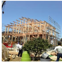
建築・リフォーム