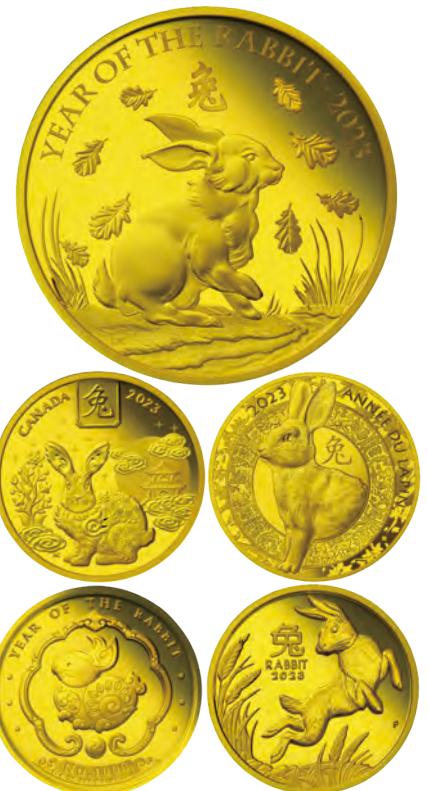
上段/英国・500ポンド金貨(原寸大) 中段/100カナダドル金貨、50ユーロ金貨 下段/1000ニュルタムカラー金貨、100豪ドル金貨

<銀貨5種セット>は、それぞれ直径が37~40.9mmサイズで、各国が発行する多彩なコインのデザインを手頃にお楽しみいただける商品となっています。