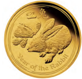
2010年発行の卯年コイン

日本人に馴染み深い「干支」をテーマに2010年の「卯年」から毎年発行されている人気シリーズです。初年度はオーストラリア1カ国が発行する4種類でしたが、近年では5カ国発行の13種類にラインアップが増加。全国の地方銀行・第二地方銀行の約半数で扱われています。また5オンス金貨をはじめとする希少価値の高い大型サイズのコレクションも近年人気を集めています。