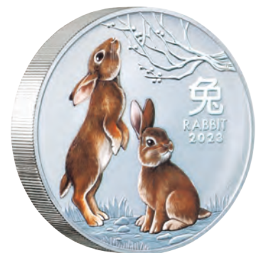
重さ約1kgの30豪ドルカラー銀貨