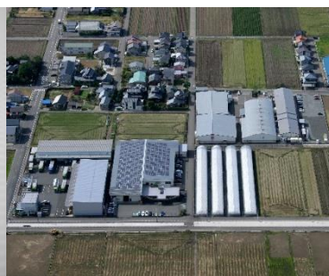
《太陽光発電システム》