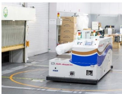
《自動搬送システム》