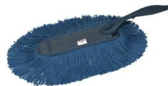
ハンディモップ・伸縮モップ

きれいなマットやモップを交換してお届けするレンタル事業、清潔な空間を提案するビルメンテナンスや、各種清掃、消毒業務、消臭作業、害虫駆除。おもてなしの心を添えた紙おしぼりや、厨房消耗品。心地良い環境づくりに欠かせないアメニティ、豊かな環境美化用品をご提供しています。