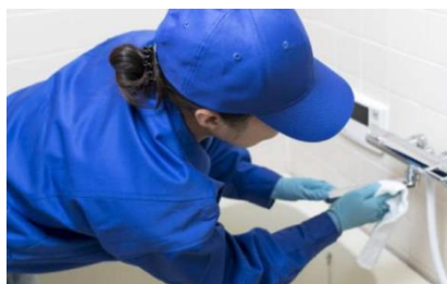
日常清掃・定期清掃