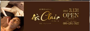
エステサロン事業