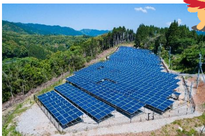
再生可能エネルギー事業