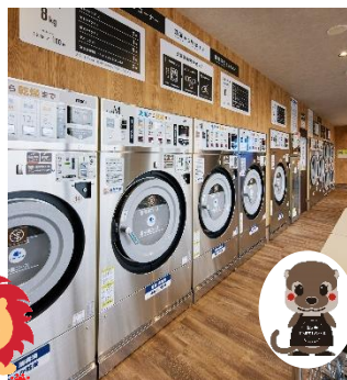
コインランドリー事業