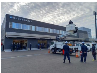
高所作業車訓練中