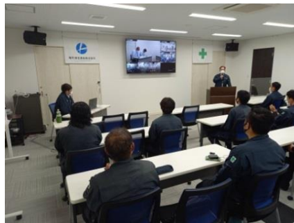
安全朝礼は欠かせません