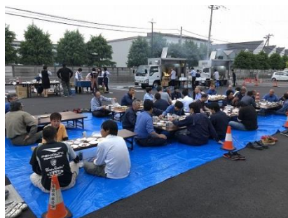
年に一度の懇親会