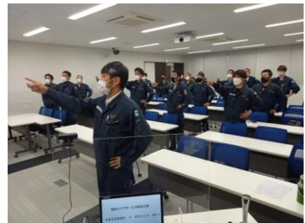
「今日もゼロ災でいこう、ヨシ！」