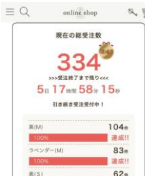
△レッドレーベルアイテム・受注画面