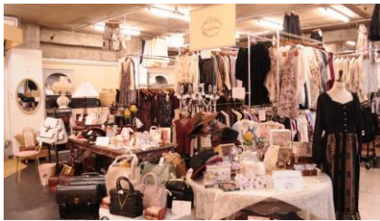
△axes femme Vintage store