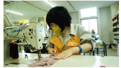
△障がい者支援センターひまわり

商品をつくる過程でできる細かな端材や余った生地をアップサイクルし、新しい商品に生まれ変わらせることも実施。福井県の障がい者支援センターひまわりの皆さんが1つ1つ手作りで作成してくれています。