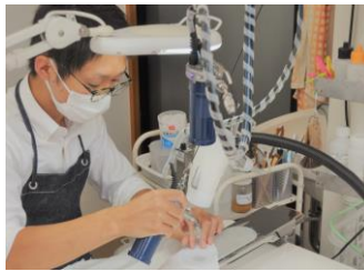
△かわいクリーニング