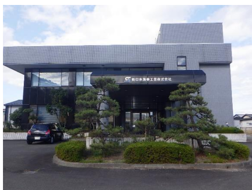
新日本海事工業株式会社 本社