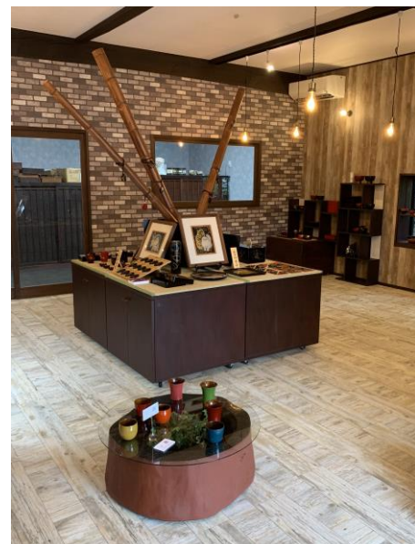
うるしギャラリー久右衛門