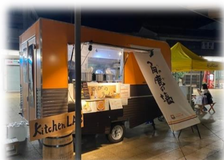
敦賀駅前でのケータリング