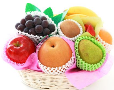
果物の盛り合わせ