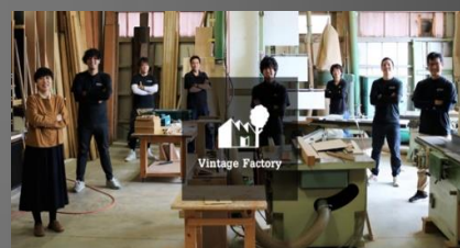
Vintage Factory 富山市黒瀬255-2