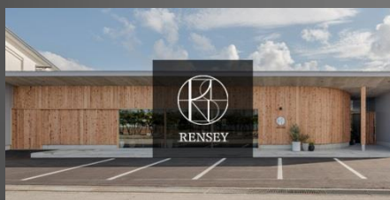
RENSEY 金澤本店 金沢市荒屋1丁目11