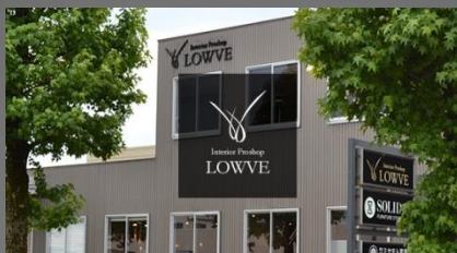
Interior Proshop LOWVE 富山市西荒屋551-1