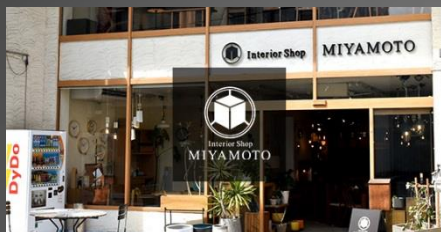
Interior Shop MIYAMOTO 富山市千石町1-1-6