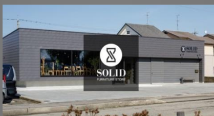
SOLID FURNITURE STORE 金沢市荒屋1丁目104