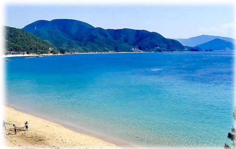
<テラスから見える水晶浜の景色>

新たに営業開始したカフェ「NEU」店舗内の様子です。みなさま、是非お立ち寄りくださいませ。