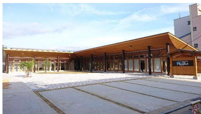
大野市 五番商店街 商業施設 Popolo. 5