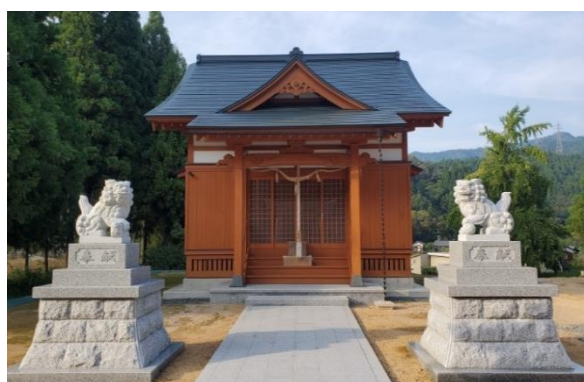
白山神社(福井市計石町)

弊社の起源は、初代が宮大工の棟梁として創業したことが始まりです。 これまでの、熟練の技術をもとに、神社仏閣の修理修繕も手掛けております。