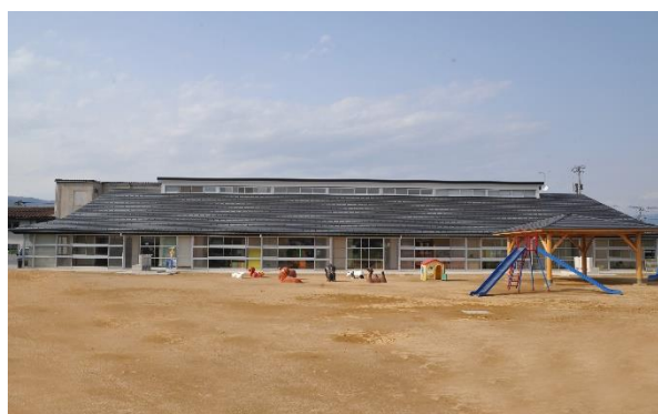
社会福祉法人 まこと福祉会 誓念寺こども園