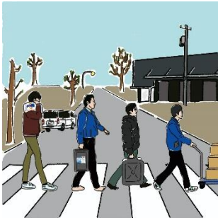
医薬品・工業薬品の販売