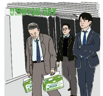
大人用紙おむつの販売