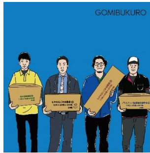
自治体指定ごみ袋の製造