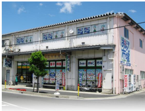
みんなのおかし市場福井店

・みんなのおかし市場公式サイトBtoC/amazon店/みんなのおかし市場おやつ店BtoB