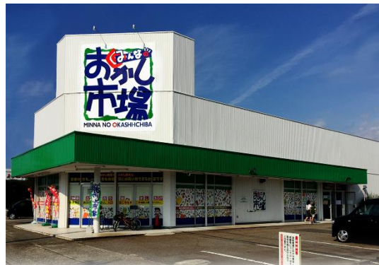
みんなのおかし市場金沢高尾台店