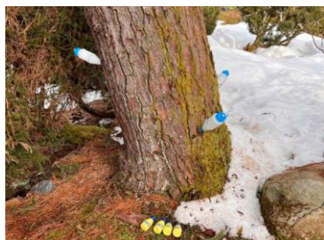
少し弱っている松に「樹幹注入」を行う様子