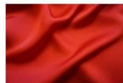
マイクロキュプラ