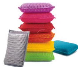
食器洗いスポンジ