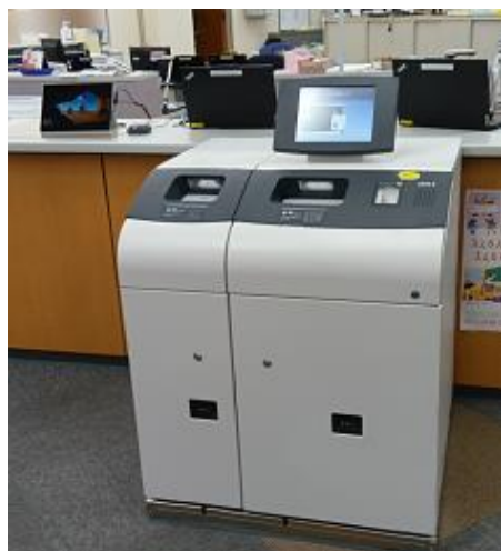
【窓口自動入出金機（※）】