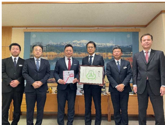
小松市役所にて寄附贈呈式が開催されました。

ホンダカーズ石川さまは、地球環境の保全を最重要課題のひとつと捉え、自動車の販売・整備を通じて人の健康の維持と地球環境の保全に積極的に努め、お客さまや地域社会に喜ばれるグリーンディーラーを目指しています。また、CO 2 排出量前年度比6%削減を目標に掲げ、環境保全活動を実施しています。