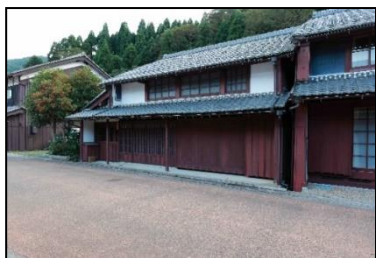
<建物外観（内装工事中）>