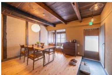
<（参考）内装イメージ>