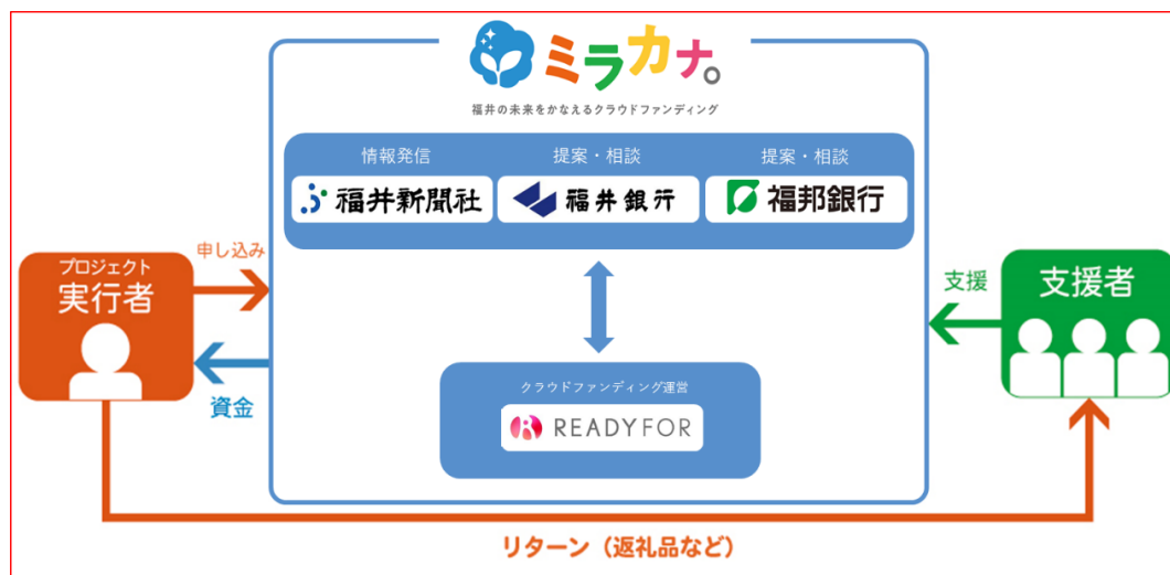
図：「ミラカナ。」枠組みのイメージ

また、新たな枠組みとなって初めての共同事業として、クラウドファンディングの活用と成功につなげるための「ミラカナ。」セミナーをオンラインにて実施いたしますので、合わせてお知らせいたします。