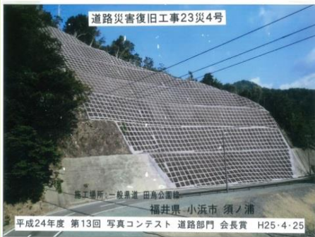
須ノ浦道路災害復旧工事