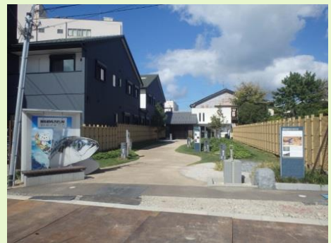
鯖街道ミュージアム