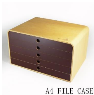
A4 FILE CASE -5段-