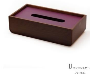
U ティッシュケース -10ポケット-