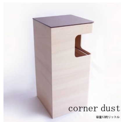
corner dust 容量12リットル