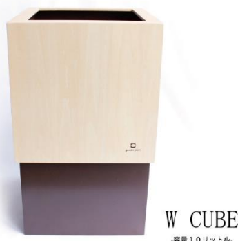
W CUBE -容量10リットル-