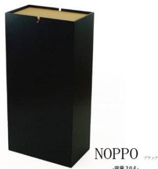
NOPPO フック -容量20L-