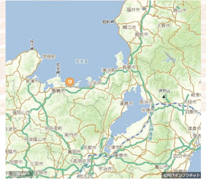
城山荘・城山公園位置▼