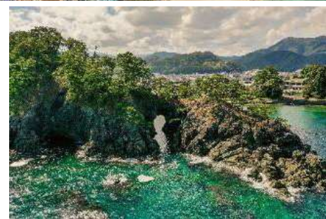
北側からの明鏡洞▲